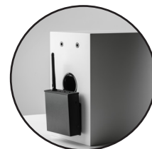
Direkt an die Lautsprecheranschlüsse angeschlossen