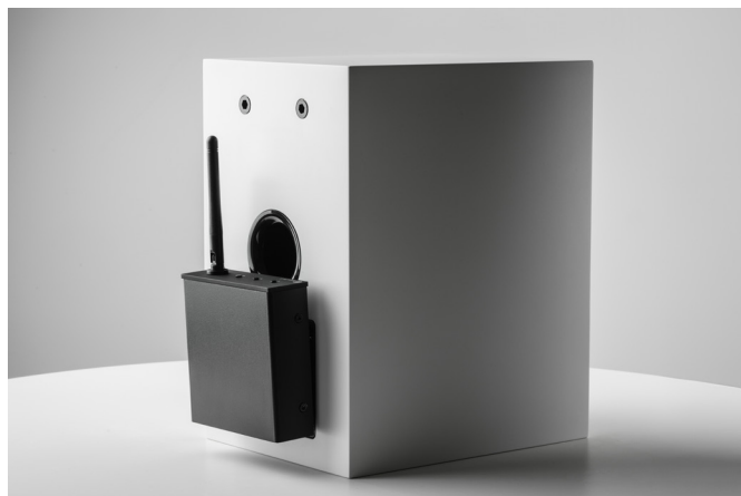
Die Wireless Box E kann direkt an Pro-Ject-Lautsprecher angeschlossen werden, zum Beispiel an die Speaker Box 3 E (links) und die Speaker Box 5 E (rechts).