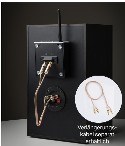
Verlängerungskabel separat erhältlich

Ein Connect it LS Flex-Verlängerungskabel ist separat erhältlich und erweitert die Kompatibilität sowie die Flexibilität des Systems. Das Verlängerungskabel enthält außerdem zwei Klettstreifen zur Befestigung der Wireless Box E an der Rückseite der Lautsprecher.