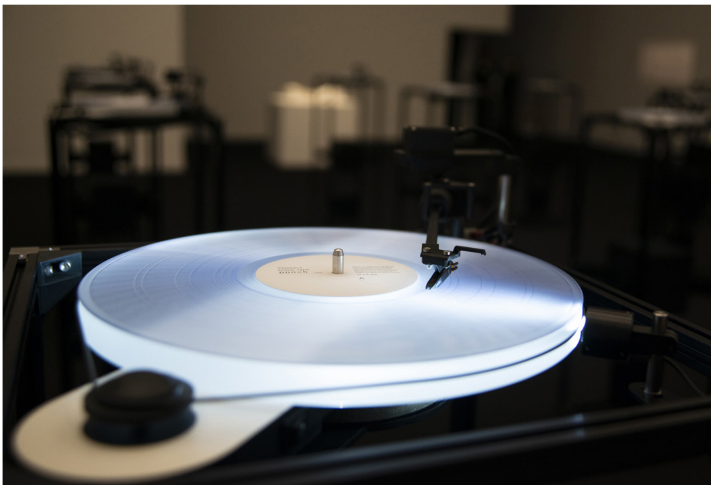
Dumb Type Installation, Playback, im Museum für zeitgenössische Kunst Tokio.

bei der Realisierung der Projekte der Gruppe gewirkt. Ihre Werke wurden auf zahlreichen Festivals und Ausstellungen gezeigt, darunter die Biennale von Venedig (2003), das Seoul International Modern Dance Festival (2005), das Melbourne International Arts Festival (2006), die Athens Concert Hall (2009) und eine Einzelausstellung im Centre Pompidou- Metz, Frankreich (2018) und Museum für zeitgenössische Kunst Tokio (2019).