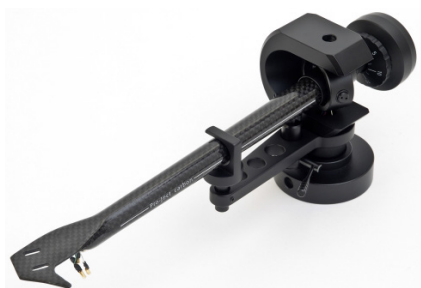
Carbon-Tonarm: Nicht-resonantes Rohr mit reibungsarmen Lagern.